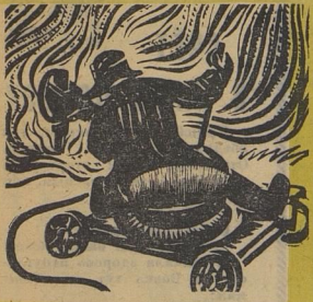
Рубка корки электролита на алюминиевом заводе.