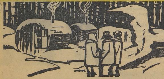
На Михайло-Шаховском лесопункте.